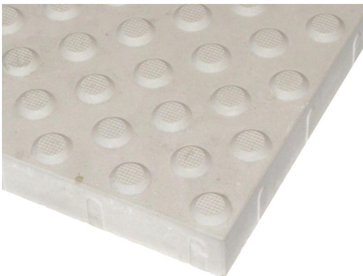
Rys. 2a. Płytki ostrzegawcze – szczegół powierzchni